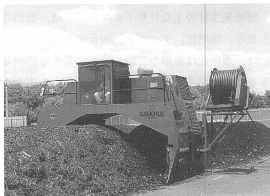
写真3 屋外製造、切返し状況