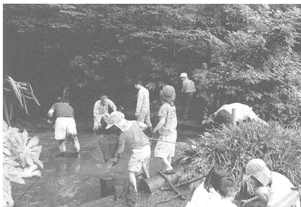
「関さんの森」池の掃除