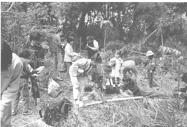
「溜の上の森」親子で植樹

その第1は、現存する森林の周辺の開発規制の必要性である。現行では市街地にある貴重な森林といえども、その隣接地には開発の規制は無く、境界のぎりぎりまで利用が可能である。しかし森林を健全な姿で生育させるためには、枝葉、根を隣の領域ま