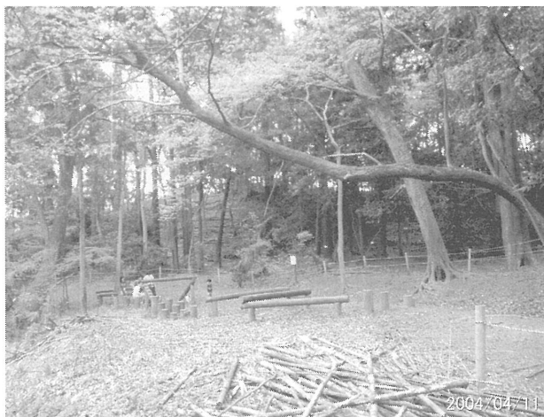
早春の「関さんの森」