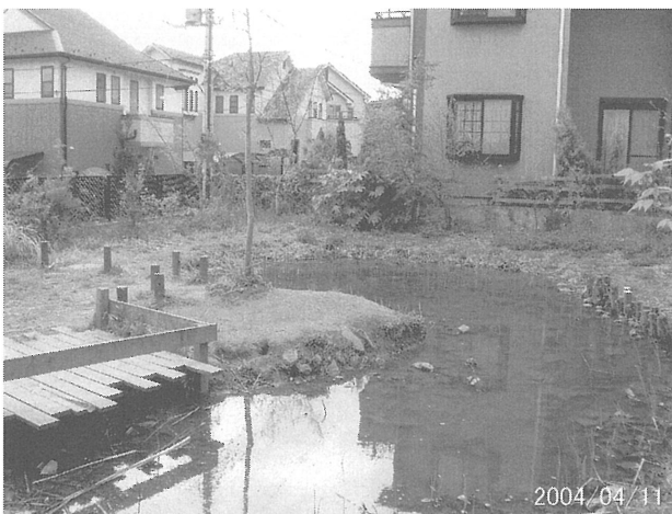
早春の「幸谷ビオトープ園」

育む会は平成8年に発足して、現在会員は240家族。毎月第2木曜日と第3日曜日を定例活動日として活動を行っている。活動は、年間のスケジュールにより、それぞれの森に応じた管理作業と、自然観察、そして、地元の小学校を始め、森林体験教室の