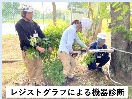
レジストグラフによる機器診断