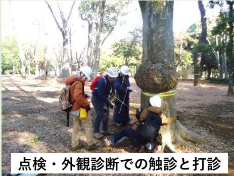
点検・外観診断での触診と打診