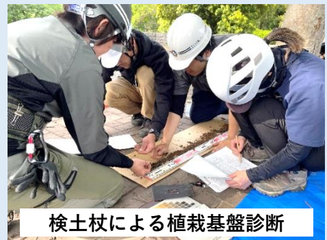
検土杖による植栽基盤診断