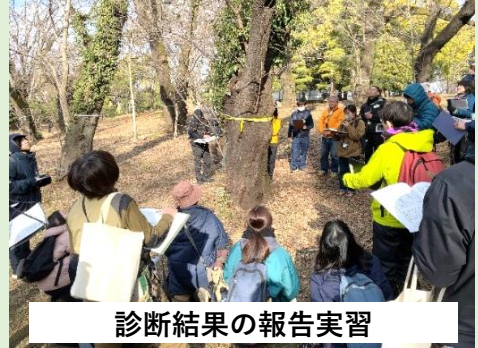
診断結果の報告実習