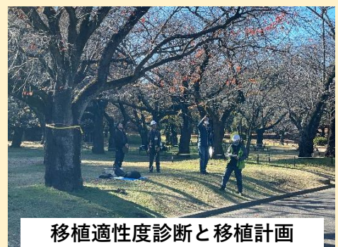
移植適性度診断と移植計画