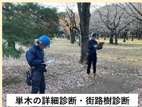
単木の詳細診断・街路樹診断