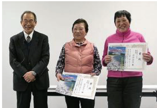
賞状を受け取ったコンクール入賞者