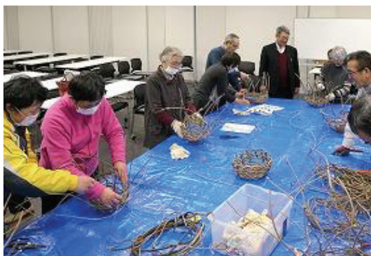
「ツルかご」づくりの様子