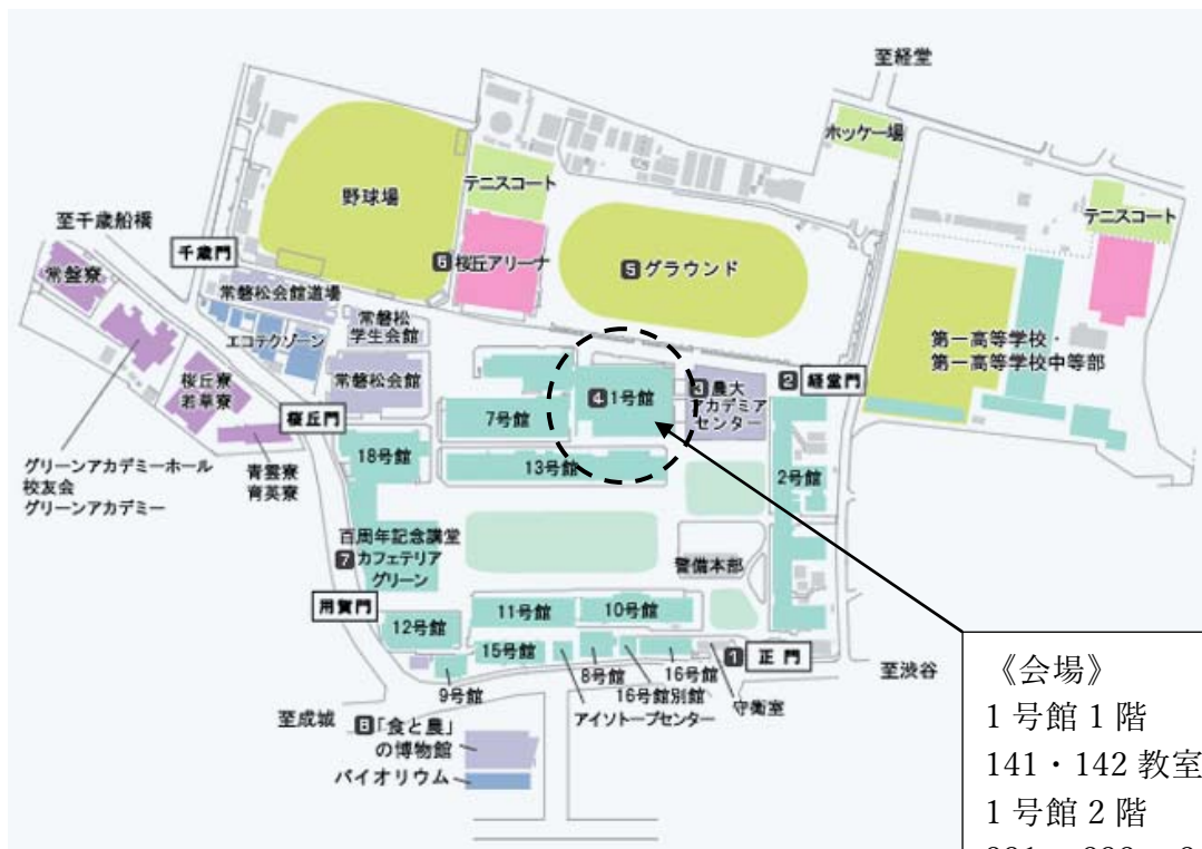
キャンパス内配置図