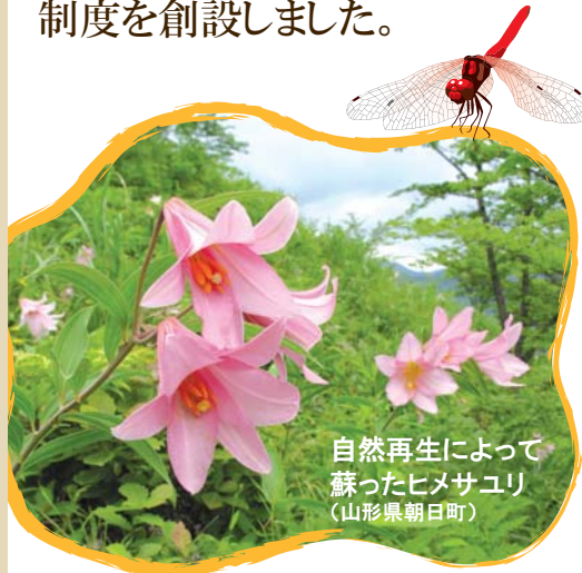
自然再生によって 蘇ったヒメサユリ (山形県朝日町)

人と自然が共生する持続可能な社会の構築と、その根源である生物多様性の保全を推進するため、自然再生に係る理念の啓発とその技術の普及を目的として、新たに 自然再生士 の資格制度を創設しました。