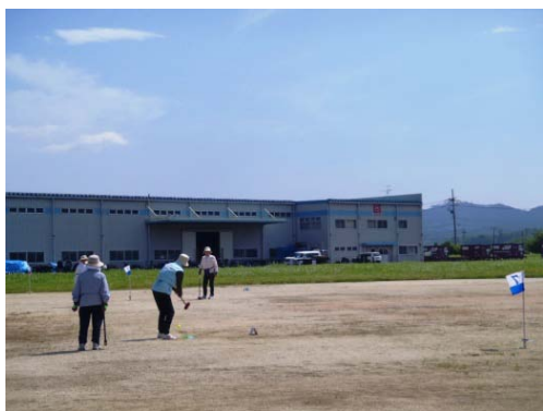
金山グラウンドゴルフ愛好会の皆様に通年無償でお貸ししています。