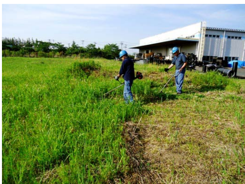
5 S活動の徹底により、緑地環境保全活動を行っています。